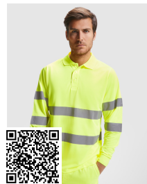
POLARIS L/S HV9306